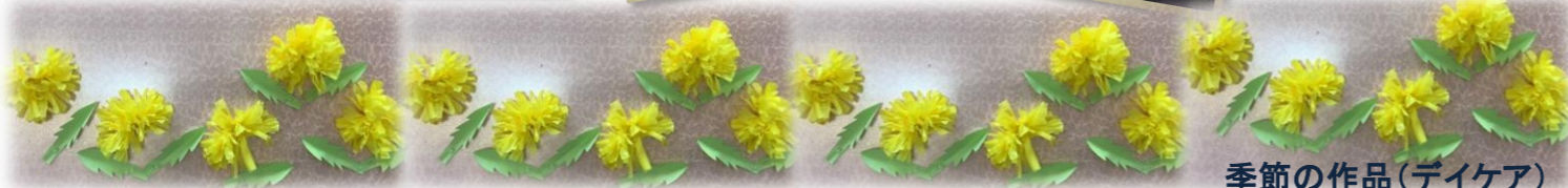
季節の作品(ダイケア)